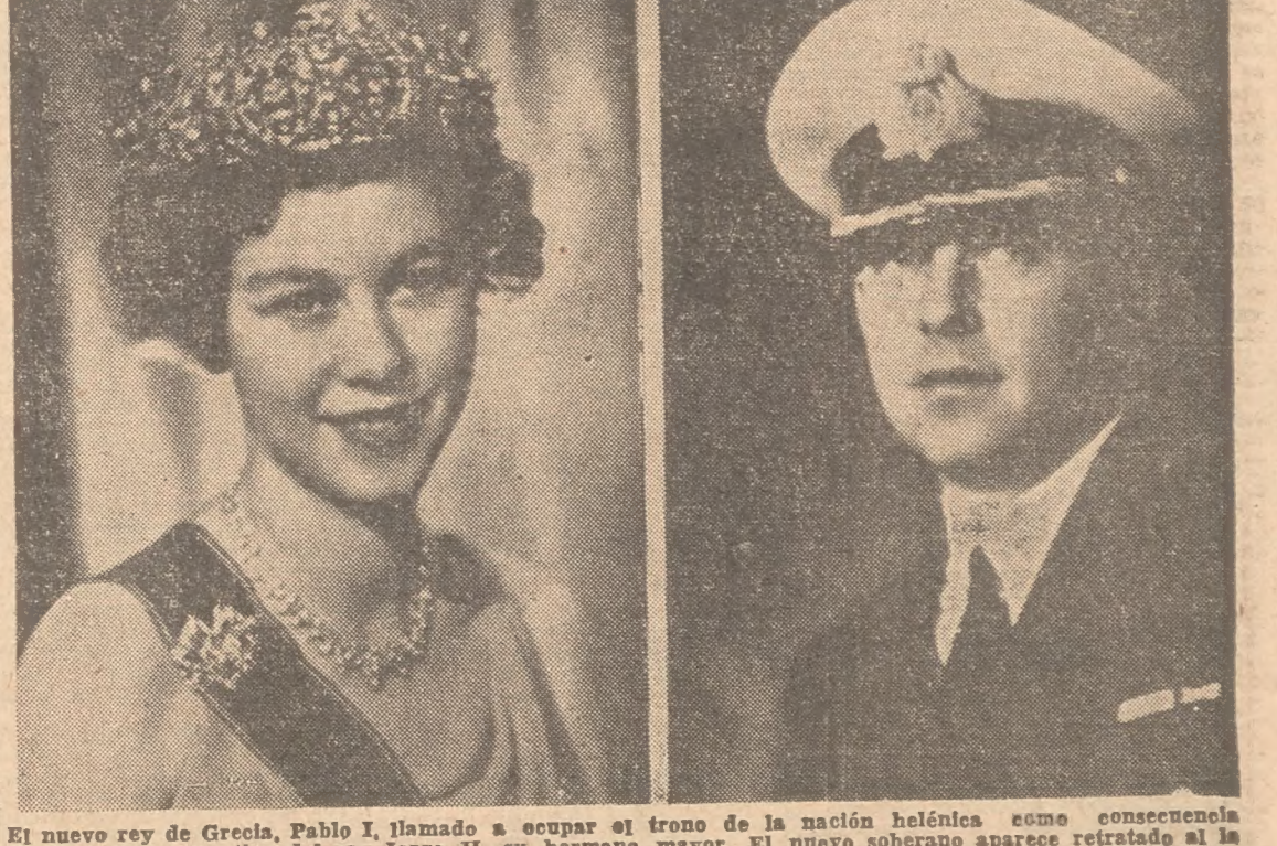
El nuevo rey de Grecia, Pablo I, llamado a ocupar el trono de la nación helénica como consecuencia de la muerte repentina del rey Jorge II, su hermano mayor. El nuevo soberano aparece retratado al lado de su esposa, la reina Federika, luciendo su uniforme de oficial de la marina.